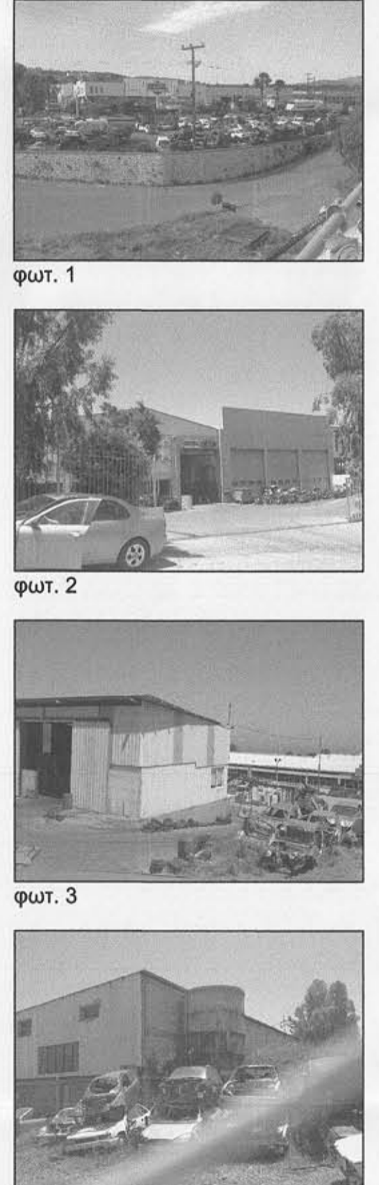
φωτ. 1, 2, 3, 4

ΔΗΜΟΣΙΑ ΜΗΧΑΝΙΚΟΥ Ν.85/177 Διεύθυνση οφείλει να το κάνει για το γεωμετρικό με στοιχεία "1+2-3...-57-58-1" με εμβαδόν 21.334,46μ² που βρίσκεται στη θέση "Γέφυρα Ζουριάς" της Τοπικής Κοινότητας Πρινης, Δημοτικής Ενότητας Νικ. Φωκά, Δήμου Ρεθύμνου Π.Ε. Ρεθύμνου οπ: