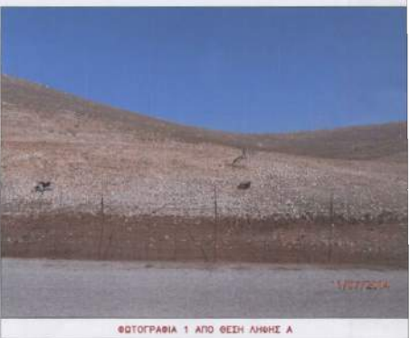
ΦΩΤΟΓΡΑΦΙΑ 1 ΑΠΟ ΘΕΣΗ ΑΝΗΣ Α

ΔΙΑΘΕΣΗ ΙΔΙΟΚΤΗΤΗΣ Ο ΚΑΤΩΝ ΥΠΟΓΡΑΦΗΜΕΝΟΣ ΒΕΘΦΙΛΟΣ ΓΕΩΡΓΙΟΥ ΚΑΛΙΔΩΝΗ ΔΙΑΦΕΡΕ ΟΤΙ, ΕΧΩ ΤΗΝ ΕΓΚΥΡΗ ΓΙΑ ΤΗΝ ΑΚΡΙΒΕΙΑ ΤΩΝ ΔΙΑΔΟΜΕΝΩΝ ΟΡΙΩΝ ΤΟΥ ΓΗΠΕΔΟΥ. ΒΕΘΦΙΛΟΣ ΓΕΩΡΓΙΟΥ ΚΑΛΙΔΩΝΗ