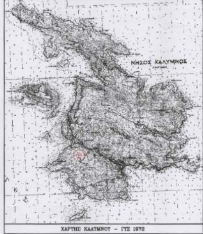
ΧΑΡΤΗΣ ΚΑΛΥΜΝΟΥ - ΓΤΣ 1972

ΤΙΤΛΟΣ ΙΔΙΟΚΤΗΣΙΑΣ Η ΥΠ' ΑΡ. 13235/08.07.2005 ΠΕΡΙΟΥΣΙΑΚΗ ΠΑΡΟΧΗ(Γ'ΟΙΚΗΚΗ) ΑΓΡΟΤΙΚΟΥ ΑΚΙΝΗΤΟΥ ΚΑΤΑ ΠΛΗΡΗ ΚΥΡΙΟΤΗΤΑ ΤΗΣ ΣΥΜΒΟΛΑΙΟΓΡΑΦΟΥ ΚΑΛΥΜΝΟΥ ΑΚΑΤΕΡΗΝΗΣ ΓΕΩΡΓ. ΚΟΥΡΕΜΕΤΗ ΚΑΙ Η ΥΠ' ΑΡ. 17467/17.12.2014 ΠΡΑΞΗ ΔΙΟΡΘΩΣΗΣ ΤΟΥ ΥΠ' ΑΡ. 13235/2005 ΣΥΜΒΟΛΑΙΟΥ Γ'ΟΙΚΗΚΗΣ ΠΑΡΟΧΗΣ ΤΗΣ ΣΥΜΒΟΛΑΙΟΓΡΑΦΟΥ ΚΑΛΥΜΝΟΥ ΑΚΑΤΕΡΗΝΗΣ ΓΕΩΡΓ. ΚΟΥΡΕΜΕΤΗ