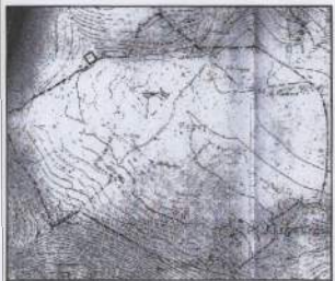
ΑΠΟΣΤΑΣΜΑ ΧΑΡΤΟΣ ΜΕ ΤΑ ΟΡΙΑ ΤΟΥ ΟΙΚΙΣΜΟΥ ΑΡΧΙΤΕΣ ΧΩΣΤ ΣΠΑ 107/08.09.1980 ΑΠΟΦΑΣΗ ΝΟΜΑΡΧΙΑΣ ΔΕΛΤΑ/ΣΩΤ

ΣΗΜΕΙΩΣΗ ΤΟ ΓΗΠΕΔΟ ΑΠΕΧΕΙ ΑΠΟΣΤΑΣΗ 1200M ΑΠΟ ΤΗ ΘΑΛΑΣΣΑ.