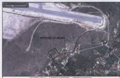
ΑΠΟΣΤΑΣΜΑ ΔΟΡΥΦΟΡΙΚΗΣ ΑΠΕΙΚΟΝΙΣΗΣ ΜΕ ΤΗ ΘΕΣΗ ΤΟΥ ΓΗΠΕΔΟΥ ΚΑΙ ΤΗΣ ΟΡΙΩΤΗΤΗΣ ΤΟΥ ΟΙΚΙΣΜΟΥ - ΟΡΘΟΦΩΤΟΓΡΑΦΙΑ 1ΗΣ ΜΑΡΤΙΟΥ 2009 -