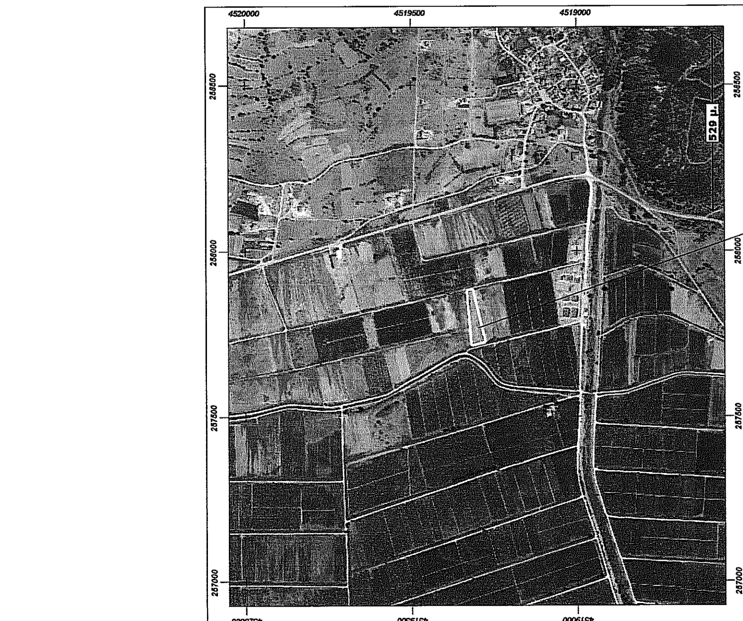
Απόσταση αεροφωτογγραμίας περιοχής κλ. 1:10000 Θέση αγροτεμαχίου