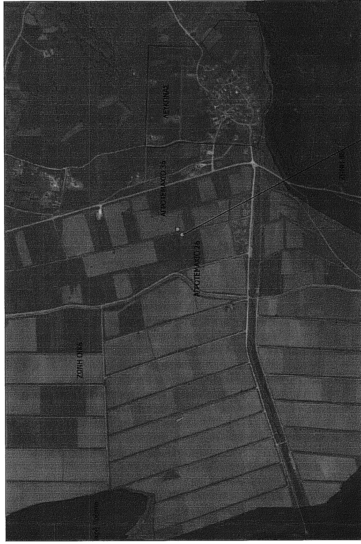
Χάρτης προοπτικός Ζώνης του τεμαχίου βάσει ΚΥΑ του Εθν. Πάρκου Πρασίνων (28651/ΦΕΚ 302Δ/23-7-2009) (χωρίς κλίμακα) Θέση τεμαχίου στην ΟΙΚ6