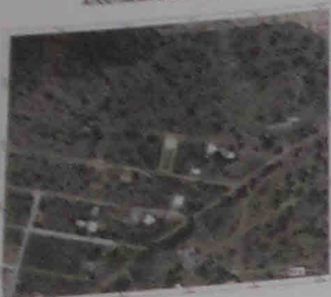
ΑΝΤΙΣΤΡΑΦΙΚΟ ΟΡΘΟΜΕΤΡΙΚΟ ΧΑΡΤΟΥ Γ.Υ.Σ. 64526 ΚΑΙΜΑΚΑ 1:5000