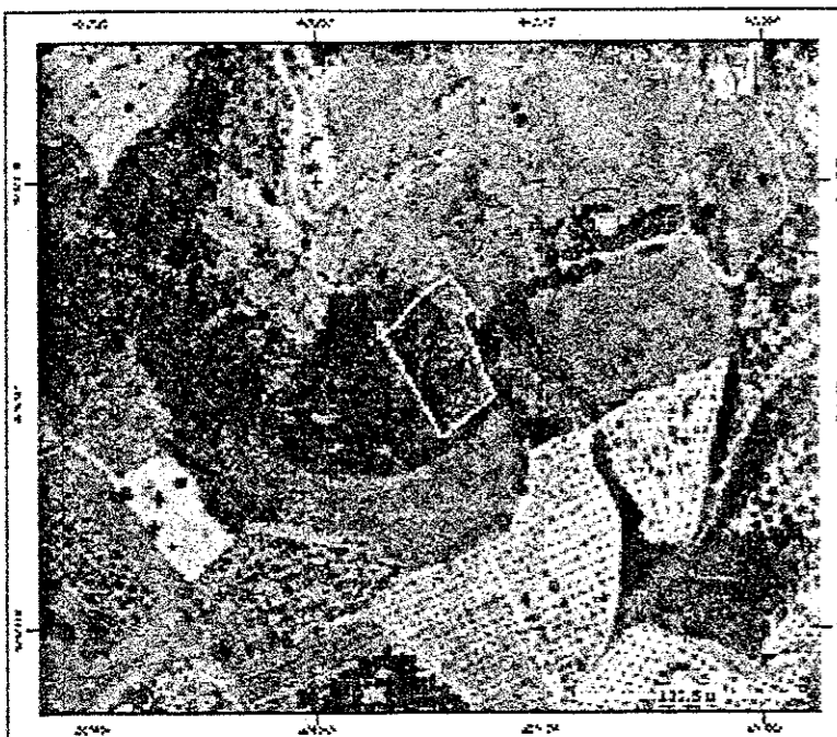
ΑΠΟΣΠΑΣΜΑ ΔΟΥΡΥΦΟΡΙΚΗΣ ΑΠΕΙΚΟΝΙΣΗΣ

Ελέγχθηκε η έκταση με στοιχεία ...Α, Β, Γ, Δ, Ε, Ζ, Η, Θ, Α... Εμβαδόν Ε = ...3.000,00 τ.μ... και διαπιστώθηκε ότι δεν εμπίπτει στους νόμους και στις διατάξεις της Δασικής Νομοθεσίας - Ο Ελεγκτής - ΤΖΙΤΖΙΛΑΡΗ Δ. ΠΗΡΕΑΣΣΗ ΔΑΣΟΛΟΓΟΣ