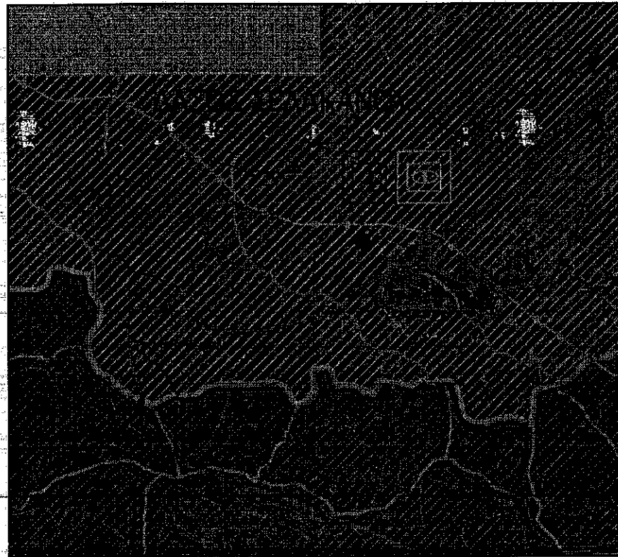
ΣΥΣΧΕΤΙΣΜΟΣ ΑΚΙΝΗΤΟΥ ΜΕ ΤΟ ΧΑΡΤΗ ΧΡΗΣΕΩΝ ΓΗΣ ΤΟΥ ΣΧΟΛΙ ΙΕΡΑΠΕΤΡΑΣ ΣΕ ΚΛΙΜΑΚΑ 1:25.000