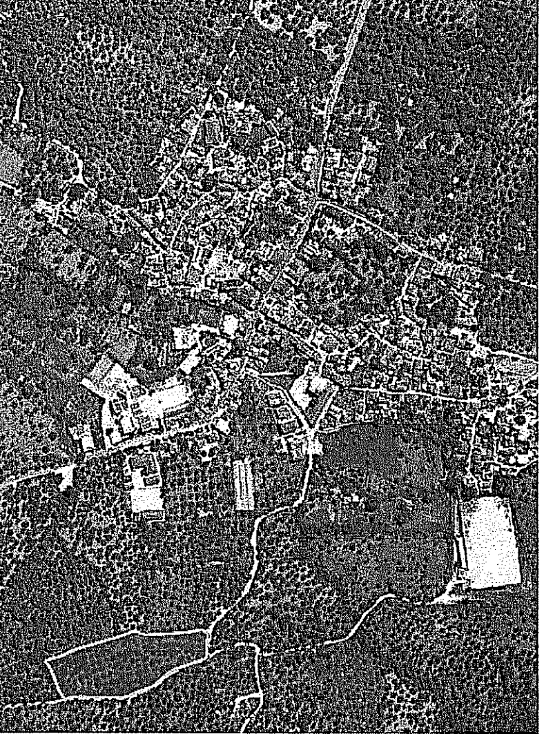
Αεροφωτογράφημα θέσης ακινήτου

ΤΣΟΥΛΑΛΗΣ ΜΙΧΑΗΛ ΑΠΗΛΑΜ ΠΟΛΙΤΙΚΟ ΓΡΑΦΕΙΟ ΠΕΡΙΦΕΡΕΙΑ ΛΕΣΒΟΥ Λ.Φ.Μ. 116927930 - Δ.Ο.Υ. ΜΥΤΙΛΗΝΗΣ