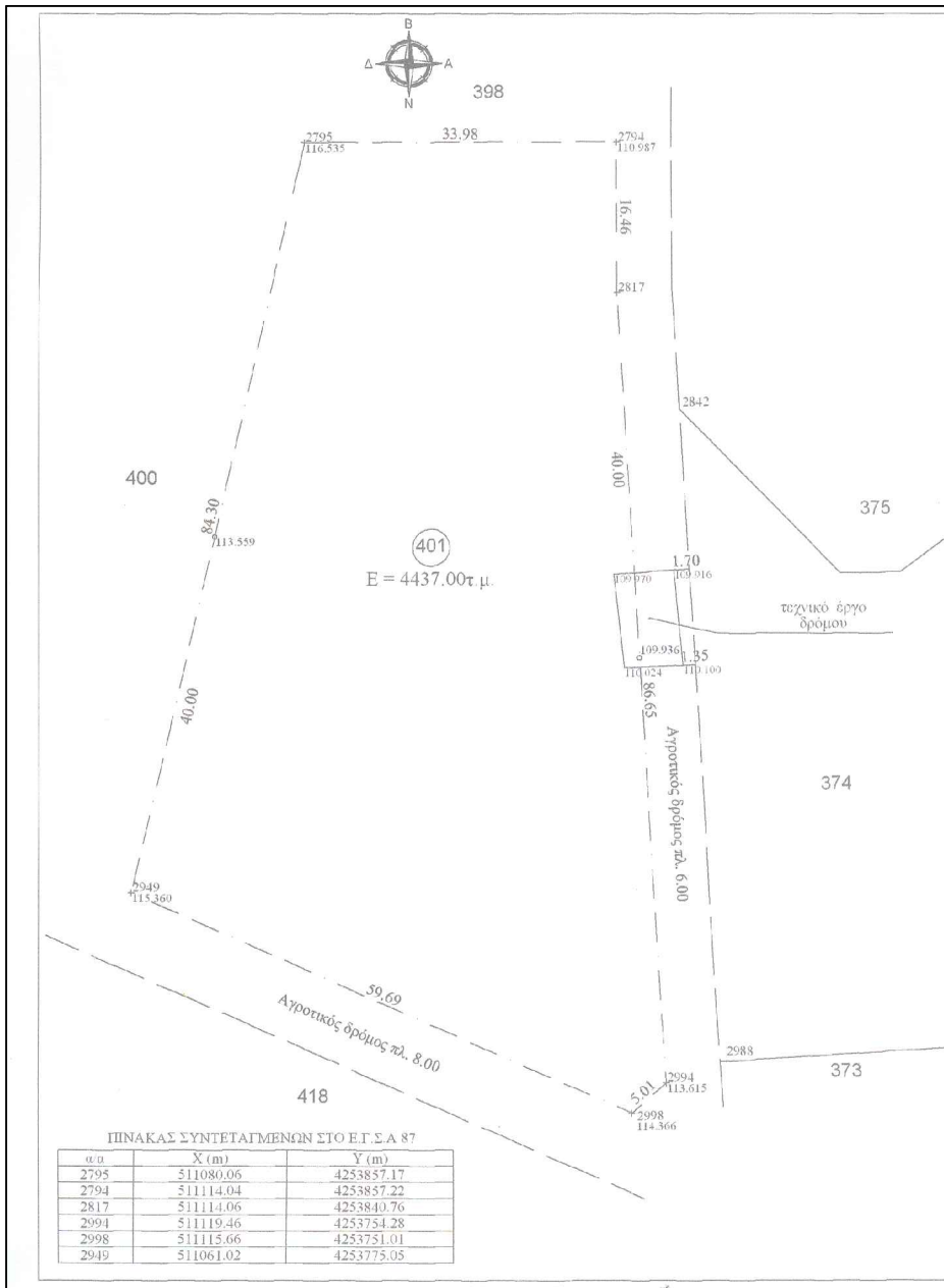
ΠΙΝΑΚΑΣ ΣΥΝΤΕΤΑΓΜΕΝΩΝ ΣΤΟ Ε.Τ.Σ.Α 87