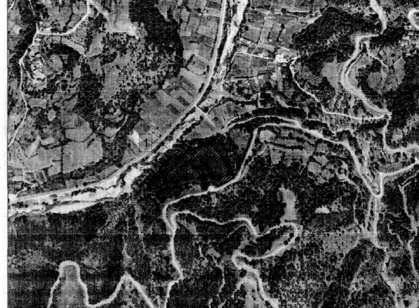
ΑΠΟΣΠΑΣΜΑ ΟΡΘΟΦΩΤΟΧΑΡΤΗ