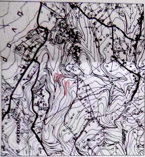
ΑΝΟΜΟΝΟΜΟ ΓΡΑΜΜΑΤΟΓΡΑΦΙΑ ΚΑΤΑΝΟΜΗΣ 1:2000 ΚΑΤΑΣΤΑΣΗ 27/03/2005