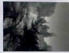
ΦΩΤΟΓΡΑΦΙΑ ΑΠΟ ΒΕΣΗ ΑΝΩΤΕ 2