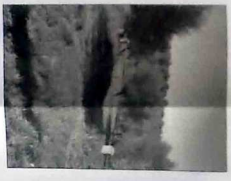
ΦΩΤΟΓΡΑΦΙΑ ΑΠΟ ΒΕΣΗ ΑΝΩΤΕ 2