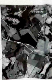
ΙΣΟΓΡΑΦΑ ΜΑΧΑΧΩΡΗΣ ΠΛΑΤΗΣ