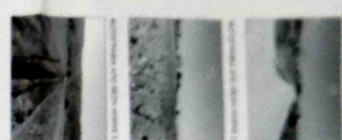
ΠΡΟΣΤΙΣΣΑΜΕΝΟ ΓΕΩΤΕΧΝΙΚΟ ΠΡΟΣΦΕΡΩΝ ΠΡΟΣΩΠΟ ΜΑΡΤΙΟΥ 11 & 2 ΔΕΚ. 11 ΚΑΤΑΣΤΑΣΗ 11/02/2011