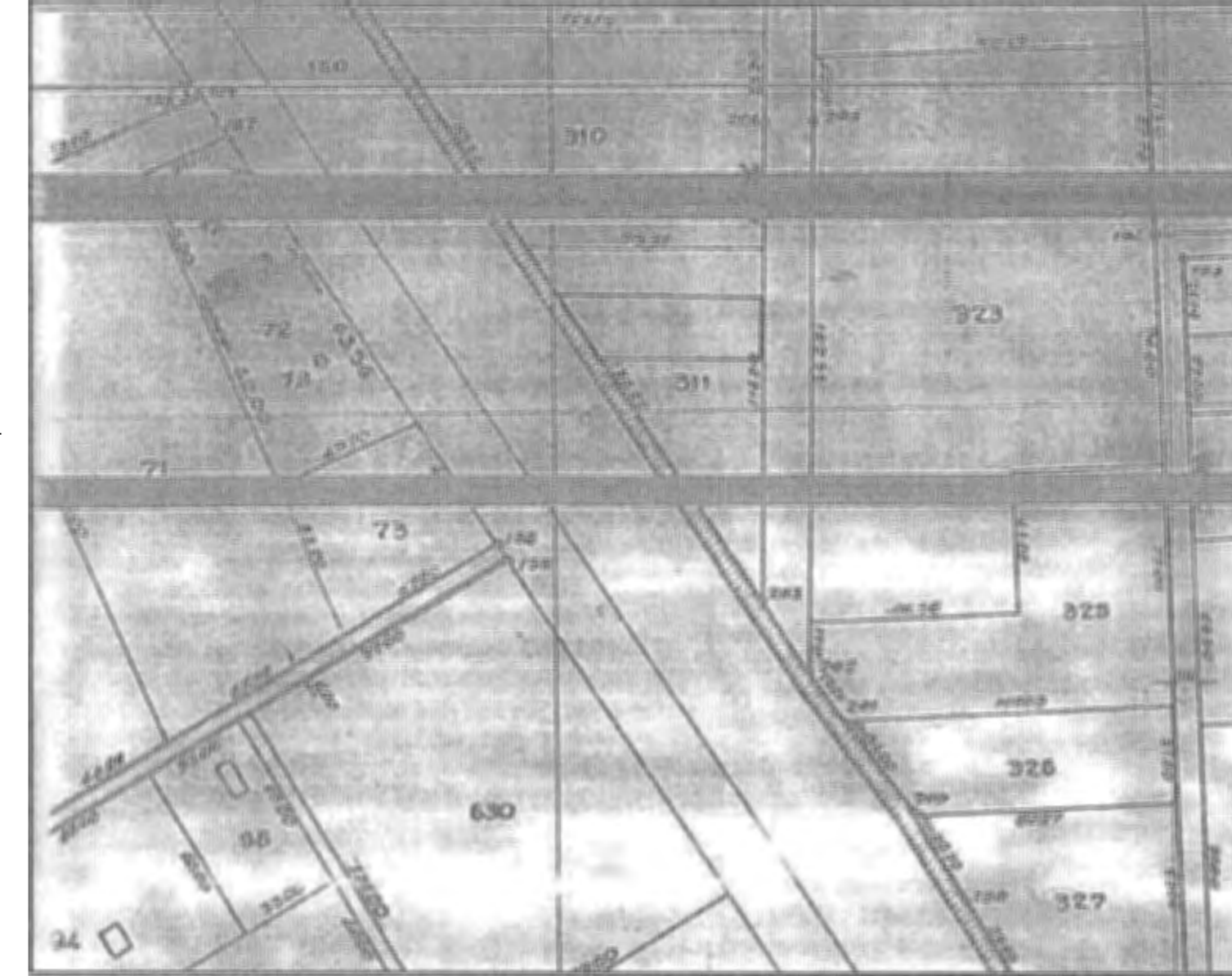
ΕΝΤΟΠΙΣΜΟΣ ΤΗΣ ΙΔΙΟΚΤΗΣΙΑΣ ΣΕ ΑΠΟΣΠΑΣΜΑ ΧΑΡΤΗ ΓΥΣ 1:50000 Φ.Χ. ΠΥΡΓΟΣ