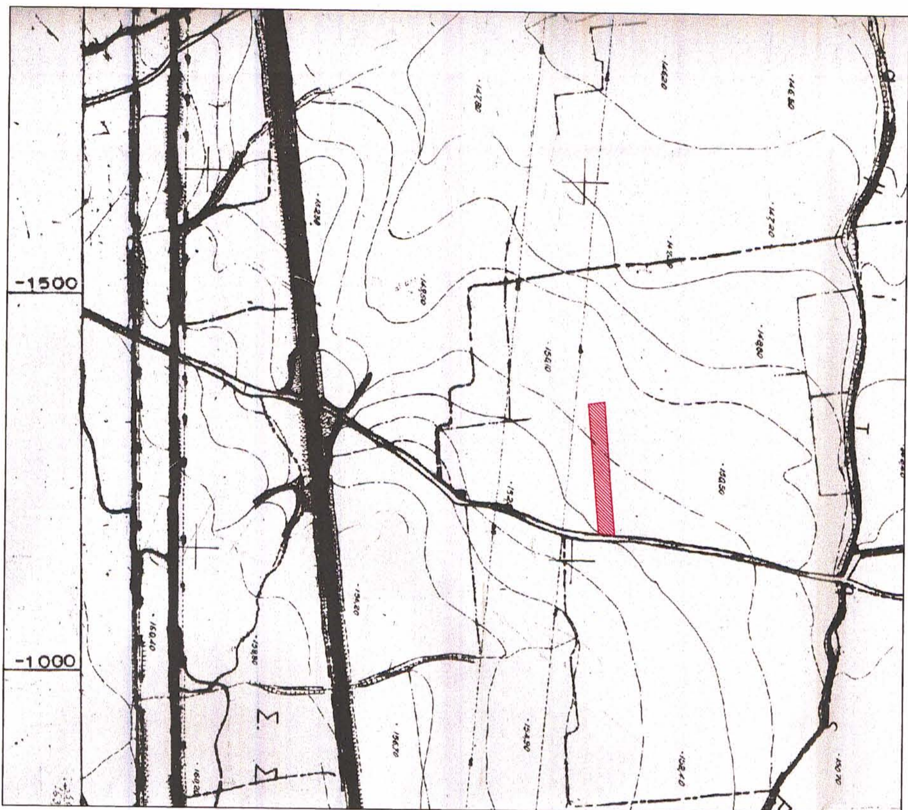
ΑΠΟΣΠΑΣΜΑ ΦΥΛΛΑΟΥ ΧΑΡΤΟΥ ΓΥΣ 6412-1 ΚΑΙΜΑΚΑ 1/5,000