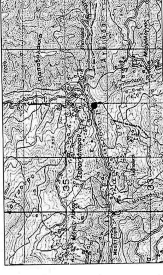
ΑΠΟΣΠΑΣΜΑ ΑΠΟ ΧΑΡΤΗ ΤΗΣ Γ.Υ.Σ. 1:50000 ΦΟΥΡΝΑ