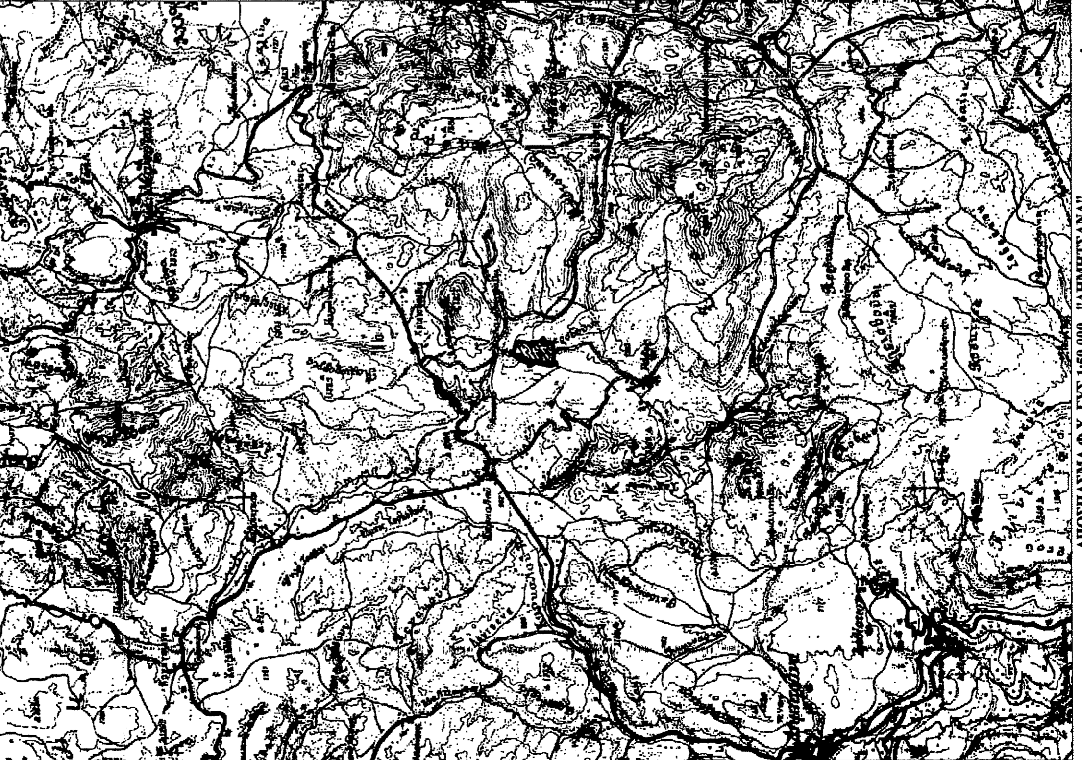
ΑΠΟΣΤΑΣΜΑ Φ.Χ. ΓΥΣ 1:50 000 - "ΑΗΜΗΤΕΙΑΝΑ"

ΕΜΒΑΔΙΑ ΕΜΒΑΔΟΝ ΑΠΡΟΤΕΜΑΧΙΟΥ: (1.2.3.....16.17.1.) = 5293,60 τ.μ.