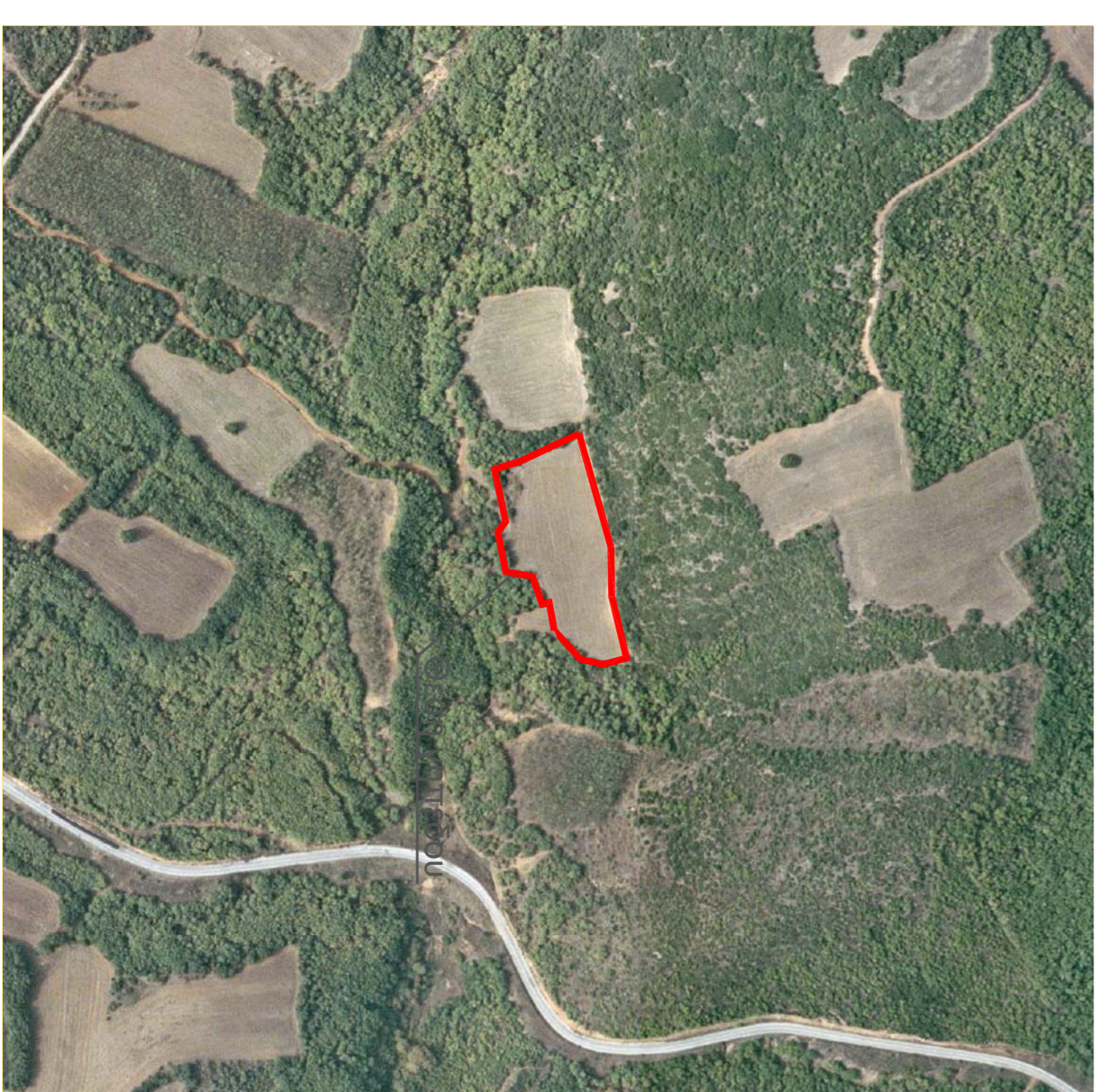
ΑΠΟΤΙΜΑΣΜΑ ΑΠΟ ΟΡΘΟΦΩΤΟΧΑΡΤΗ, ΚΛ.: 1:50.000