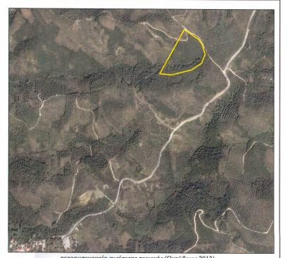
αεροφωτογράμια επίρτησης περιοχής (Οκτώβριος 2013)

Εμβαδόν (α1-α2-α3-...-α15-α16-α1) = 15.687μ²