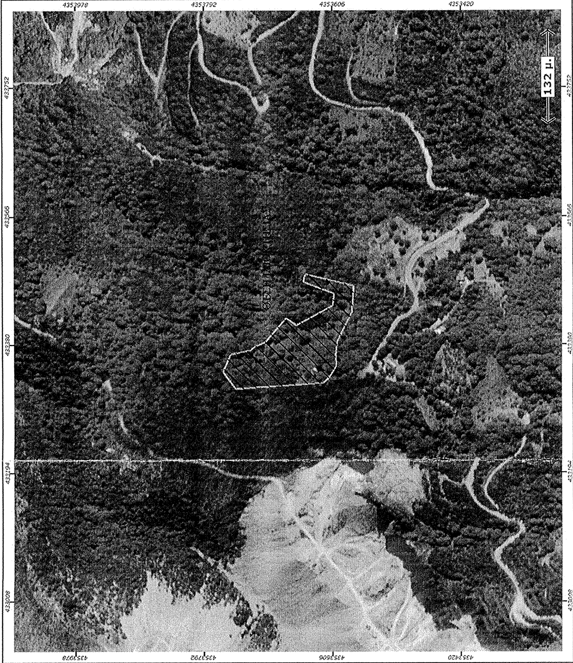
ΑΠΟΣΠΑΣΜΑ ΟΡΘΟΦΩΤΟΛΗΨΙΑΣ ΚΤΗΜΑΤΟΛΟΓΙΟΥ