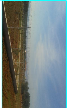
ΦΩΤΟΓΡΑΦΙΑ ΑΠΟ ΒΕΣΗ ΑΝΗΣ 1