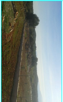
ΦΩΤΟΓΡΑΦΙΑ ΑΠΟ ΒΕΣΗ ΑΝΗΣ 2