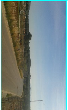
ΦΩΤΟΓΡΑΦΙΑ ΑΠΟ ΒΕΣΗ ΑΝΗΣ 3