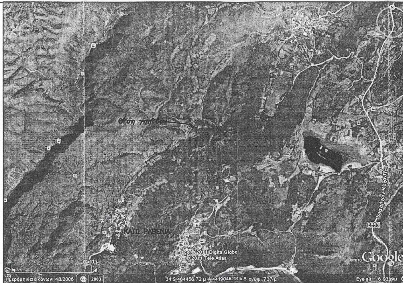
ΔΟΡΤΥΦΟΡΗ ΦΩΤΟΓΡΑΜΜΑ ΠΕΡΙΟΧΗΣ ΓΗΠΕΔΟΥ

Ελεγχος Ιωάννης 12-8-2016 Η Δασολόγος Σταυρούλα Σέλη Δασολόγος με 1 η βαθμό