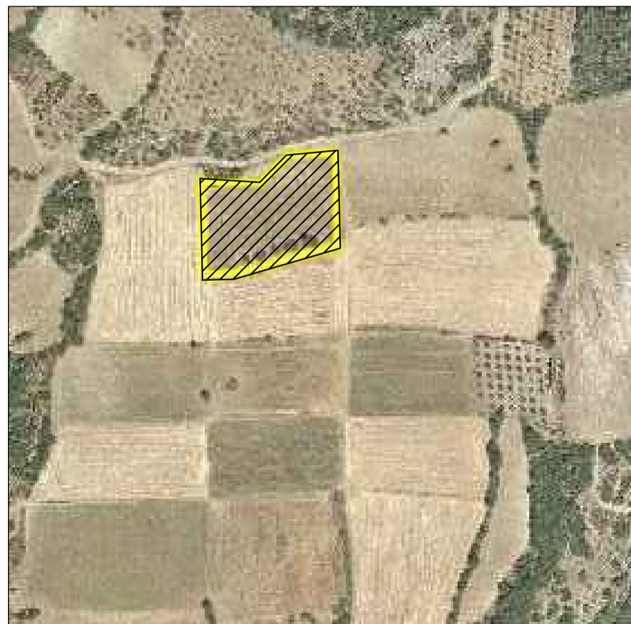
ΑΠΟΣΠΑΣΜΑ ΕΥΡΥΤΕΡΗΣ ΠΕΡΙΟΧΗΣ - ΘΕΣΗ ΚΛΗΡ/ΧΙΟΥ