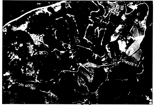
ΑΠΟΤΥΠΩΜΑ ΕΚ ΤΟΥ 368206 ΟΡΘΟΡΕΚΤΟΧΑΡΤΗ Η Υ.Γ. ΚΑΙΜΑΚΑΣ 1:5000 ΔΙΑΚΤΗΘΙΑ ΑΓΓΕΛΑΣ ΣΤΕΝΟΥ ΤΟΥ ΝΙΚΟΛΑΟΥ

ΔΙΑΖΩΣΗ Ν.651/77 Το παρόν σχέδιο έχει στοιχεία Α.Β.Γ.Δ.Ε.Ζ.Η.Θ.Ι.Κ.Λ. εκτελεσθέντος 4761,134 μ. βάσει ενός οριζοντιογράφου και ενός δόνητος. Είναι όμοιο και ομοδρόμο με το παλιό σχέδιο σύμφωνα με τις ισχύουσες νομοθετικές διατάξεις της παρούσης Ε.Κ. 2700/85 ( και με τις τροποποιήσεις του Ν998/79). Το παρόν σχέδιο αποτελείται από υπομνήματα στα οποία περιλαμβάνονται οι διαστάσεις Αποστάσεων και τα όρια ομοδρόμου > 300μ. Ομοδρόμοι σε μήκος Αποστάσεων και ομοδρόμου > 800μ. Όρια και λοιπά στοιχεία υπόκειται ο φορέας διακτήσεως του εμβασιμίου οριζογράφου. Δεν είναι έγκυρος τίτλος και τον μη γίνονται.