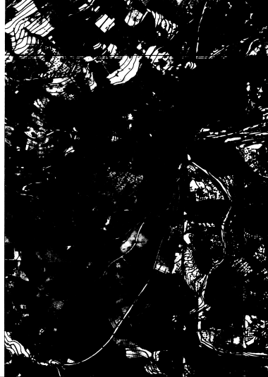
ΑΠΟΣΠΑΣΜΑ ΦΥΛΛΟΥ ΧΑΡΤΟΥ Γ.Υ.Σ. ΚΑ: 1: 8000 ΑΡΙΘΜ. ΦΥΛΛΟΥ ΧΑΡΤΟΥ 6282-8