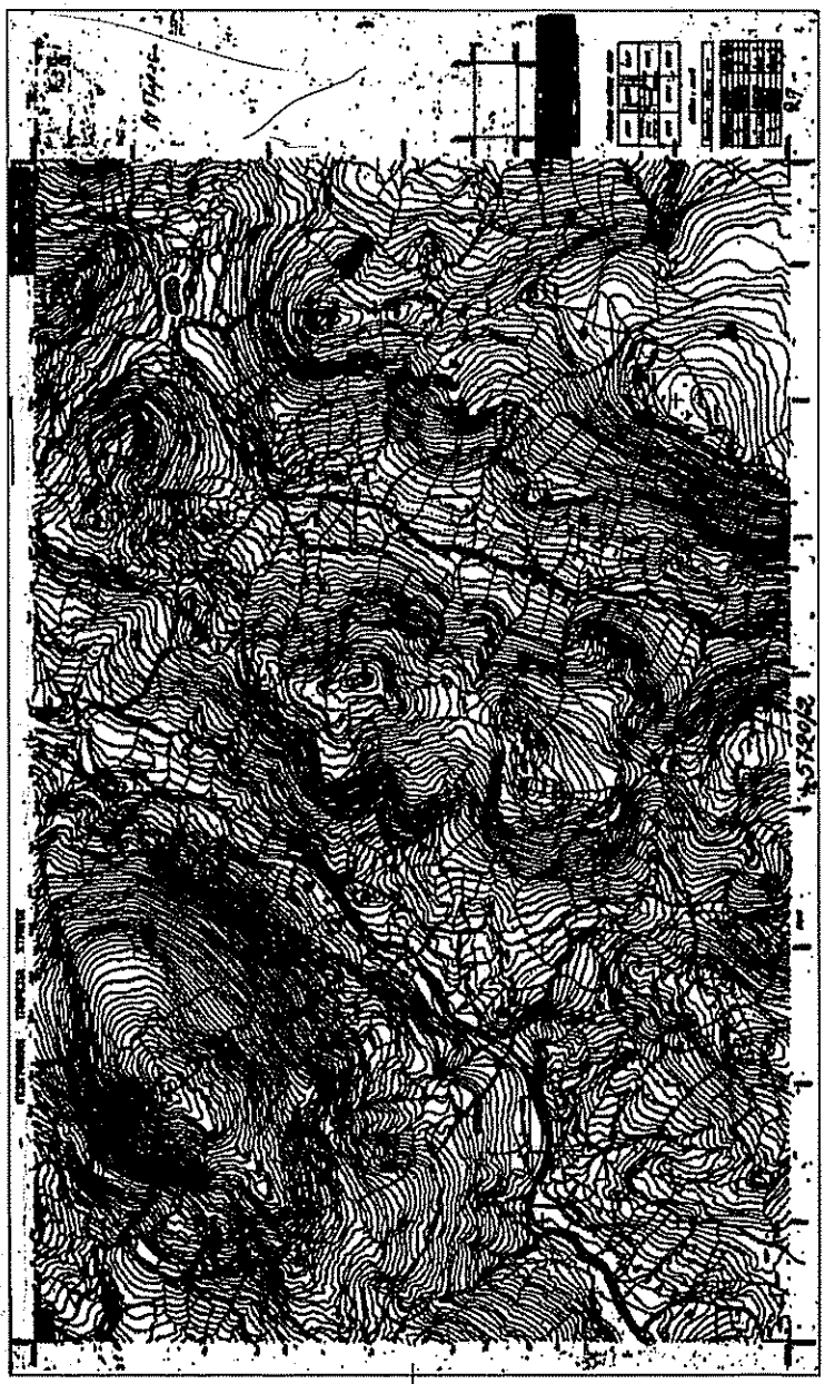
ΑΠΟΣΠΑΣΜΑ ΦΥΛΛΟΥ ΧΑΡΤΗΣ ΓΥΣ 5720/2 (κλίμακα 1:5000)

ΕΛΕΓΧΘΗΚΕ Μετρήθη... 27.8.15 ΖΑΥΑΡΟ ΚΑΛΑΙΤΟΥ ΔΑΣΟΛΟΓΟΣ