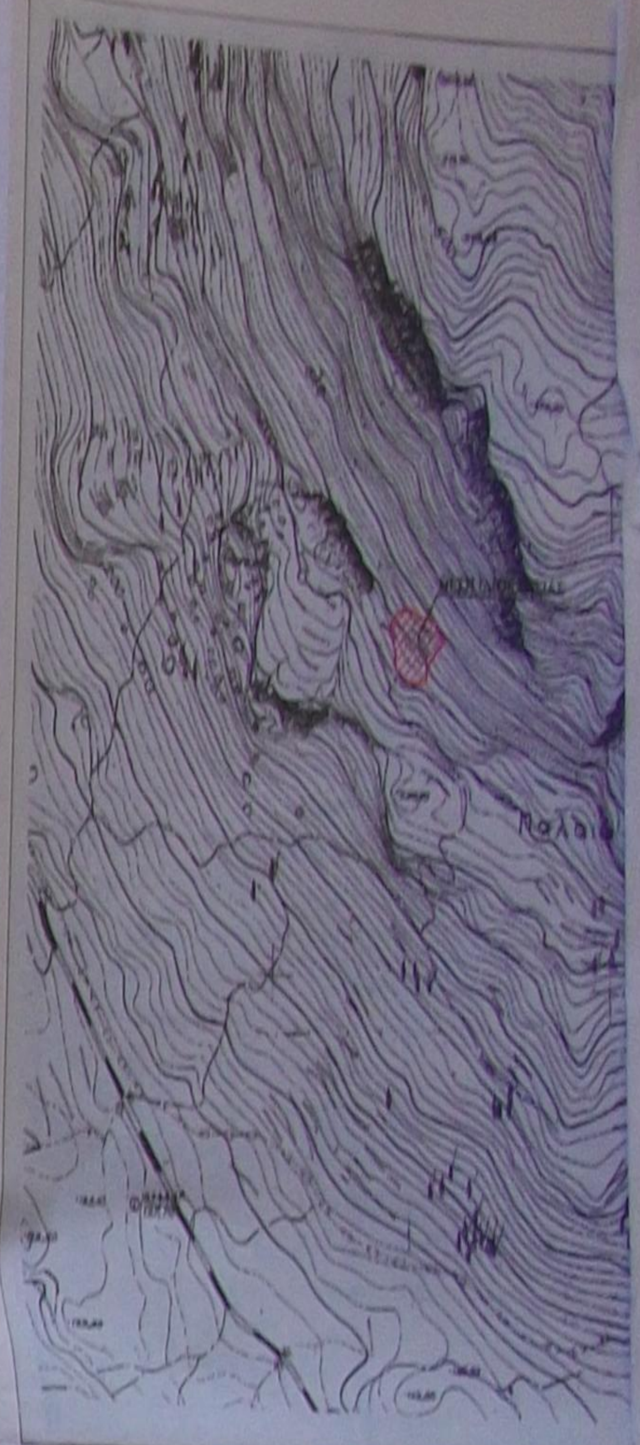
ΑΠΟΣΠΑΣΜΑ ΧΑΡΤΗΣ ΓΥΣ 61247 ΣΤ.ΚΑΛΩΝΙΑΣ Ε.5.000