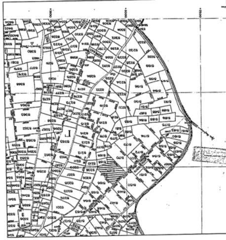
Από το σχέδιο Ορ. Διορισμός 1935