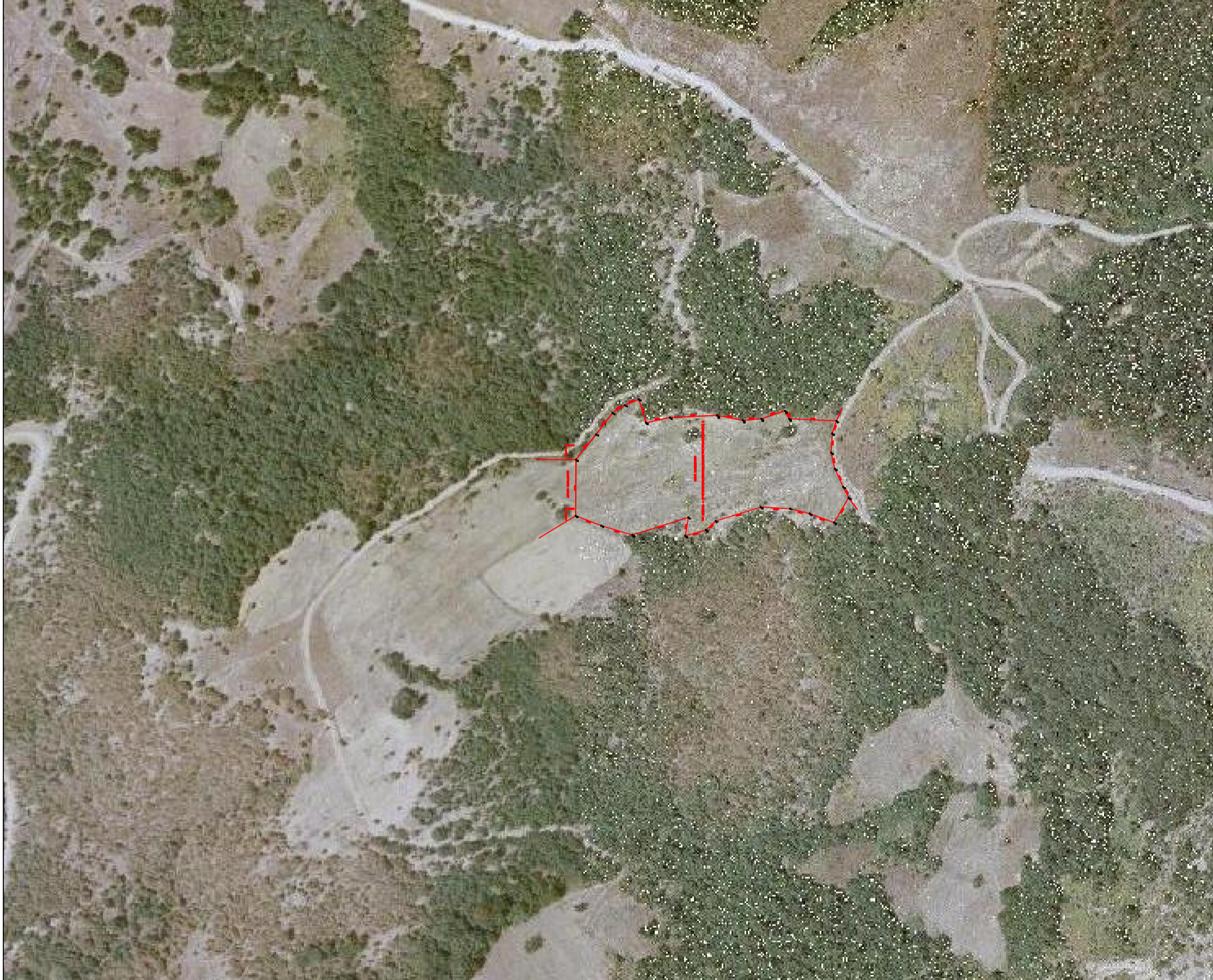
ΚΑΙΜΑΚΑ 1 : 5.000