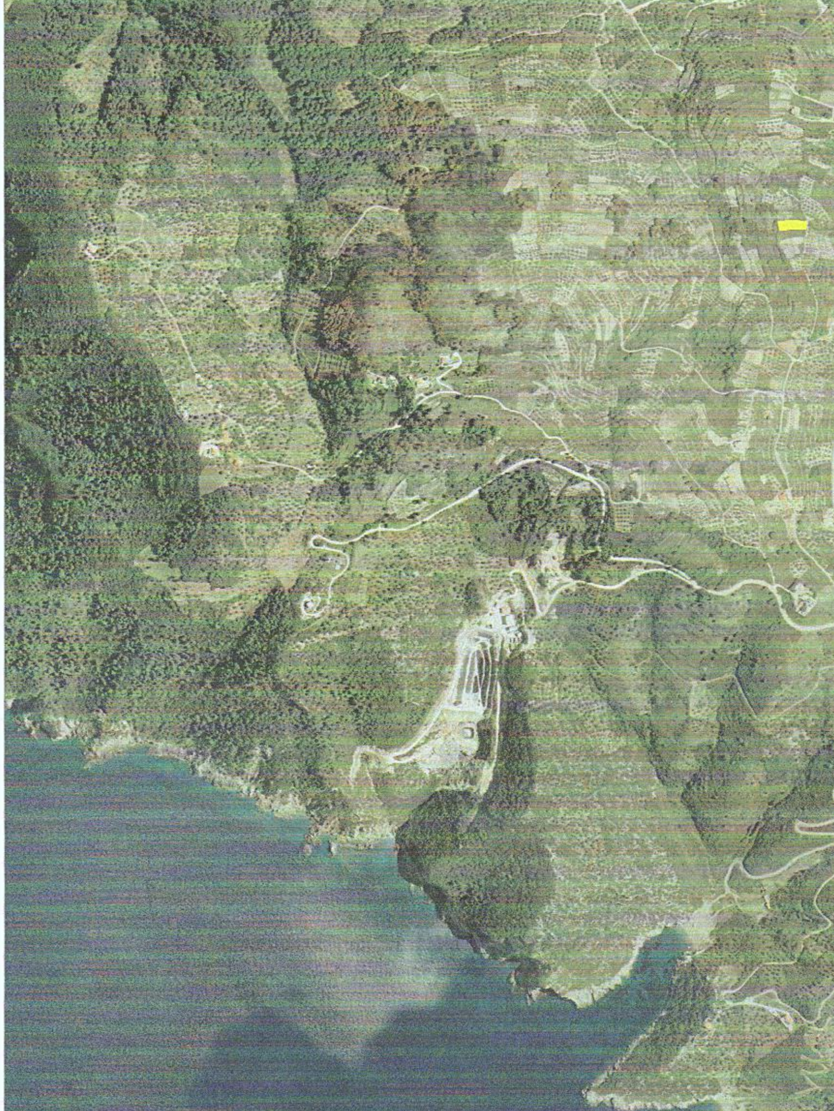
αποσπασμα χάρτη περιοχής Αλωνησσου