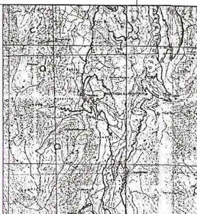
ΑΠΟΣΠΑΣΜΑ ΧΑΡΤΗ ΚΛ: 1:50000