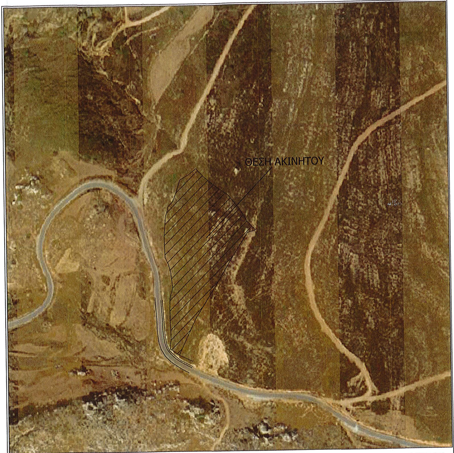
ΑΠΟΣΠΑΣΜΑ ΟΡΘΟΦΩΤΟΧΑΡΤΗ ΚΤΗΜΑΤΟΛΟΓΙΟΥ ΚΛΙΜΑΚΑ : 1/2500