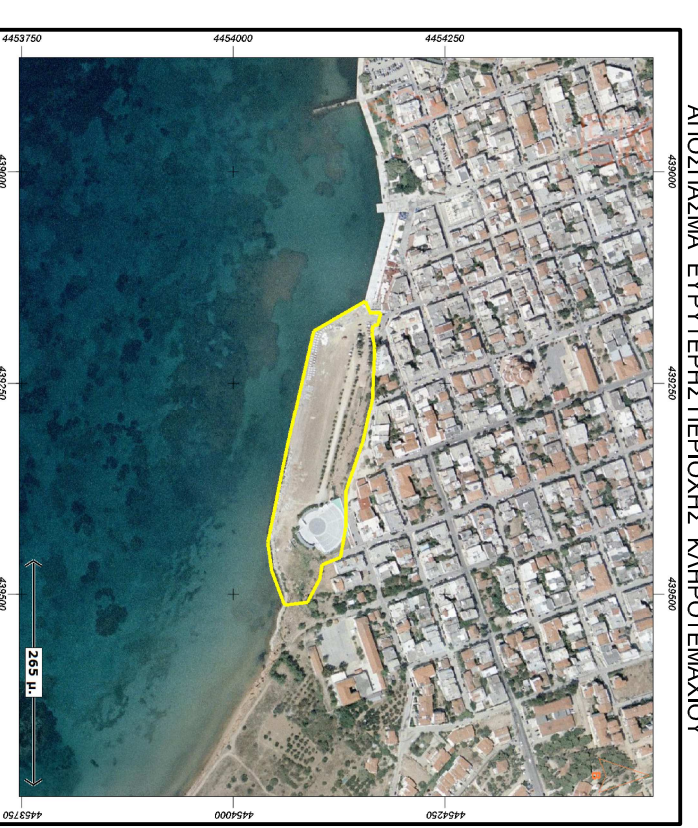
ΑΝΤΙΣΤΑΣΜΑ ΕΡΓΥΤΕΡΗΣ ΠΕΡΙΟΧΗΣ ΚΑΡΟΤΕΜΑΧΟΥ