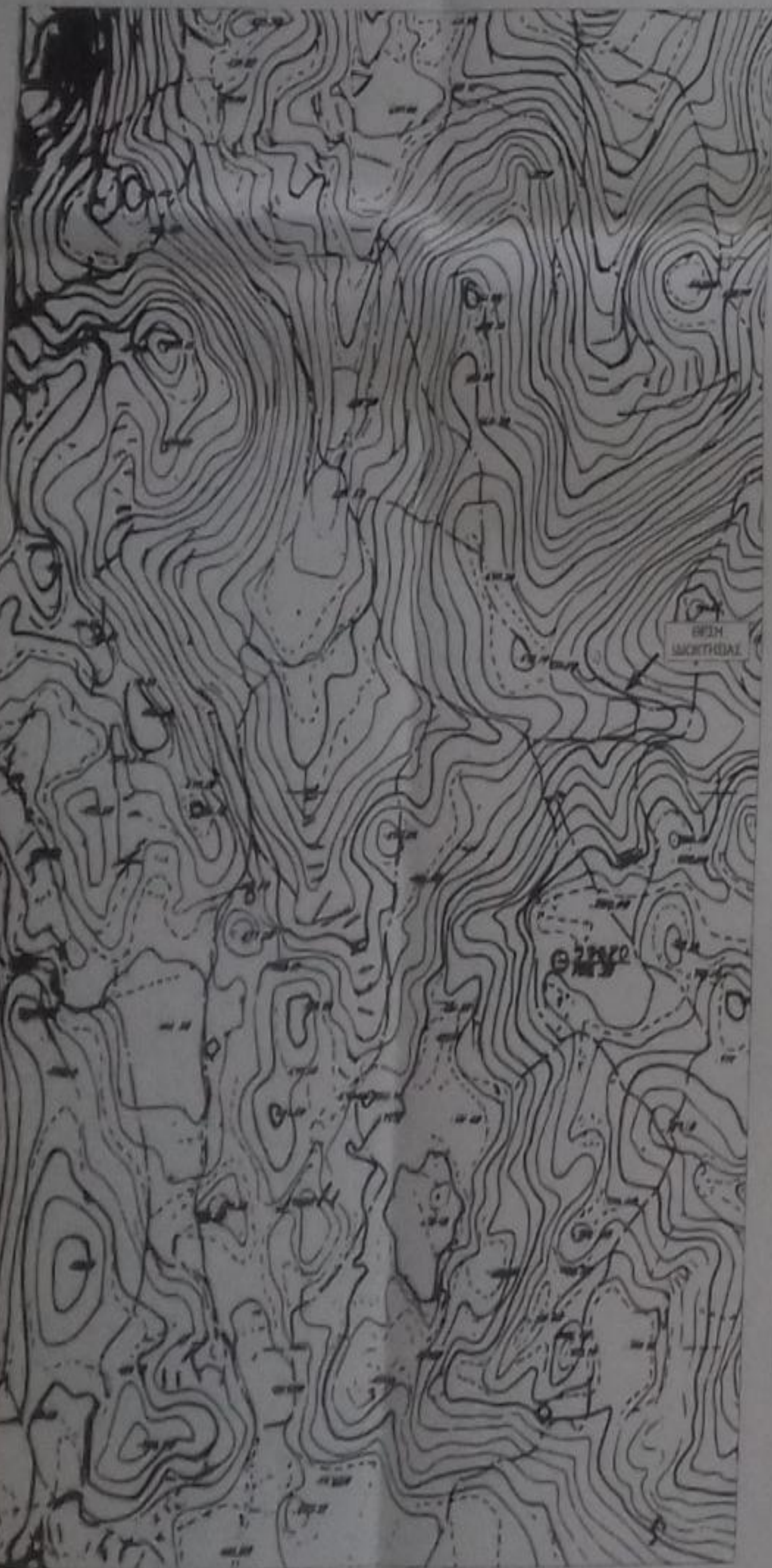
ΠΙΝΑΚΑΣ ΣΥΓΓΡΑΜΜΕΝΩΝ ΚΟΡΥΦΩΝ ΔΙΩΤΕΜΑΧΙΟΥ (ΣΤΑ. 87)