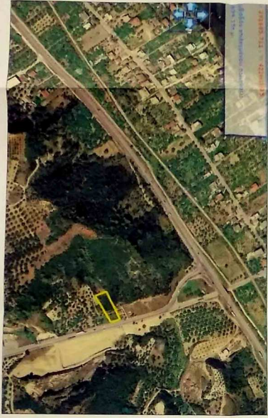
КРЕТНАВА СРЪЗНОСТНАТА КРИВАТОСТ НА МАСШТАБ 1:5000