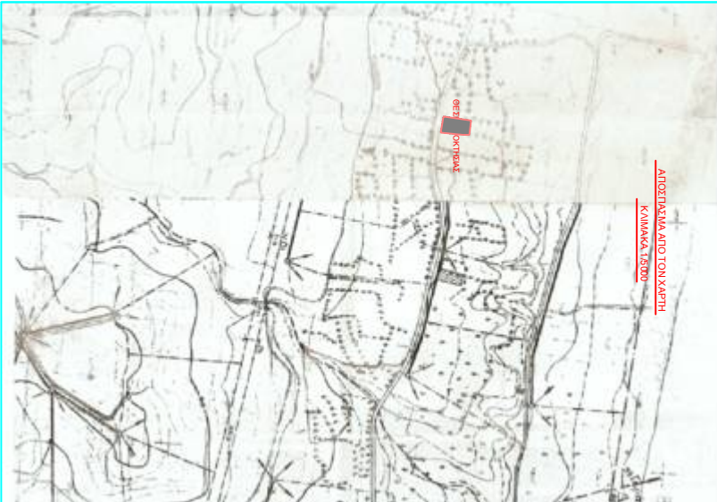
ΑΝΤΙΣΤΡΩΜΑ ΑΠΟ ΤΟΝ ΧΑΡΤΗ ΚΑΙΜΑΚΑ 18000