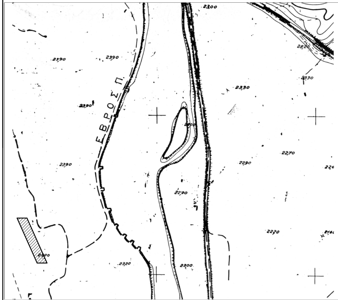
Απόσπασμα Χάρτη Αναδασμού 2001 - 2005