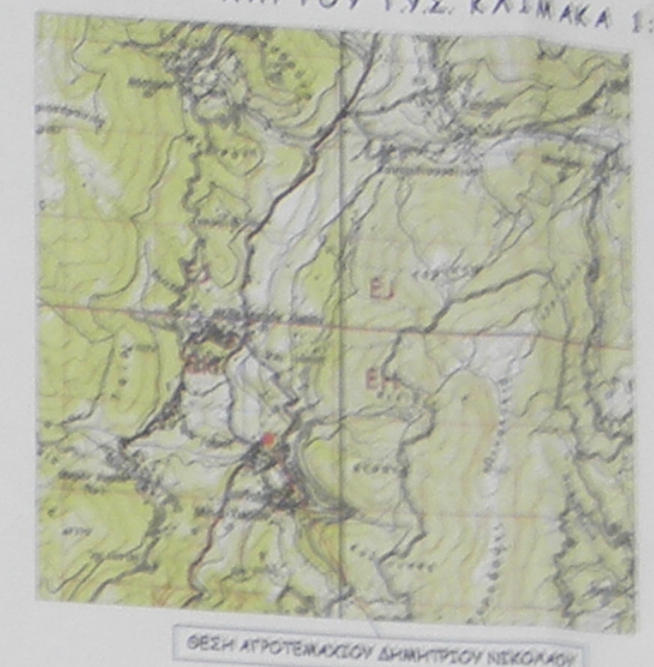
ΒΕΣΗ ΑΓΡΟΤΕΜΑΧΙΟΥ ΔΗΜΗΤΡΙΟΥ ΝΙΚΟΛΑΟΥ