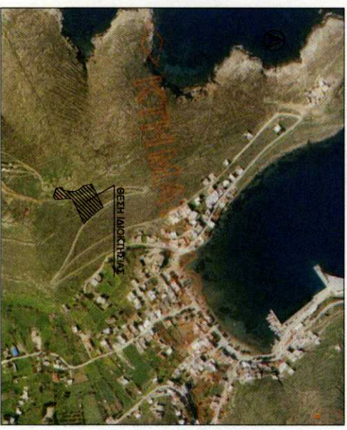
ΑΠΟΤΙΜΑΣΜΑ ΟΡΘΟΦΩΤΟΓΡΑΦΙΑΣ ΚΑΙ 1:5000