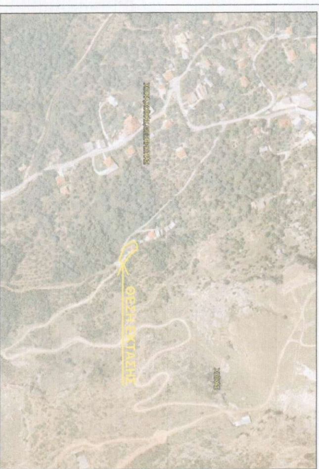
ΑΠΟΣΠΑΣΜΑ ΟΡΟΦΟΤΟΓΡΑΦΙΑΣ ΕΥΡΥΤΕΡΗΣ ΠΕΡΙΟΧΗΣ