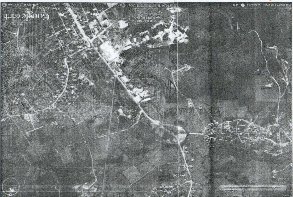
ΑΠΟΨΑΣΜΑ ΑΠΟ ΧΑΡΤΥ ΓΥΣ