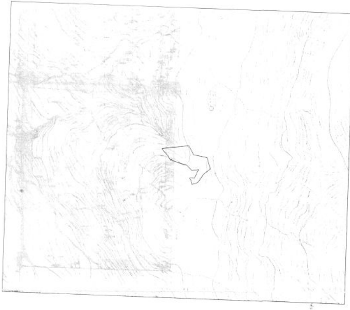
ΑΠΟΣΠΑΣΜΑ ΧΑΡΤΗ ΓΥΣ 1:5000