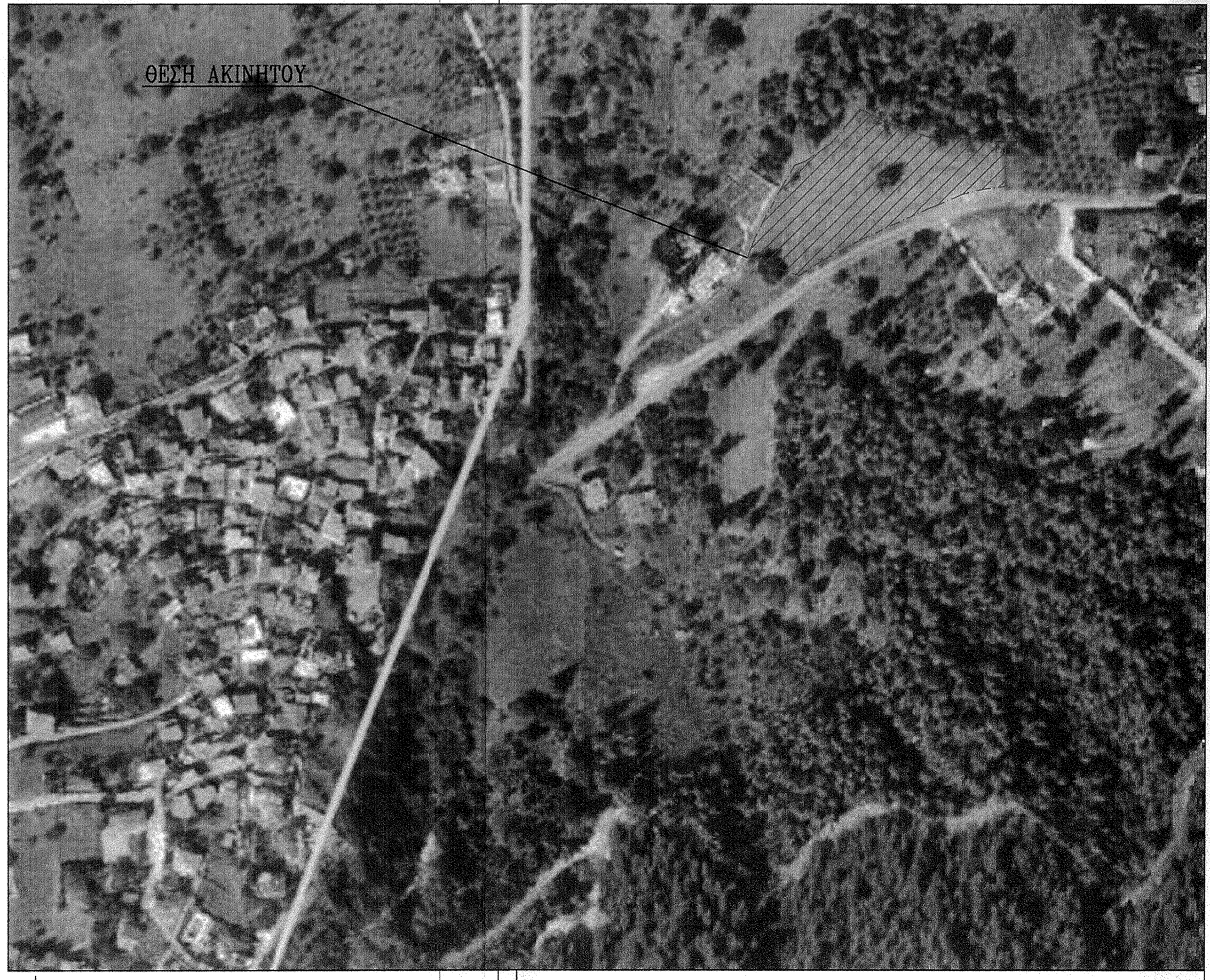
ΟΡΘΟΦΩΤΟΧΑΡΤΗΣ ΚΤΗΜΑΤΟΛΟΓΙΟΥ ΚΑ.1/2000 - ΟΔΟΠΟΡΙΚΟ

ΔΗΛΩΣΗ Ν. 651/1977 & 1337/83 Ο παρακάτω υπογεγραμμένος Διαμετρήσιμος Αγρ. Τοπογράφος Μηχανικός Σολωμός Αθανάσιος του Σπυριδελίου δηλώνει ότι το παρόν αγροτεμάχιο, που περιγράφεται ως Α1,Α2,Α3,...,Α22,Α23,Α1 βρίσκεται εκτός σχεδίου, εκτός ορίων οικισμού, είναι άρτιο και οικοδομήσιμο κατά κανόνα σύμφωνα με τις ισχύουσες πολεοδομικές διατάξεις. Το ακίνητο βρίσκεται σε απόσταση μεγαλύτερη των 1500μ. από τα θαλάσσια. Τέλος δεν διέρχονται από αυτό γραμμές υψηλής τάσης και ρέματα.