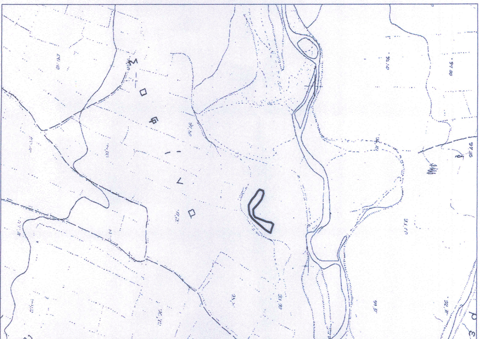
Θεση οριογραμμών (Α1, Α2, Α3, ..., Α23, Α24, Α1) σε εμπορικό χάρτη Γ.Υ.Σ., κλίμακας 1:5000 (αρ. φύλλου: 52599)