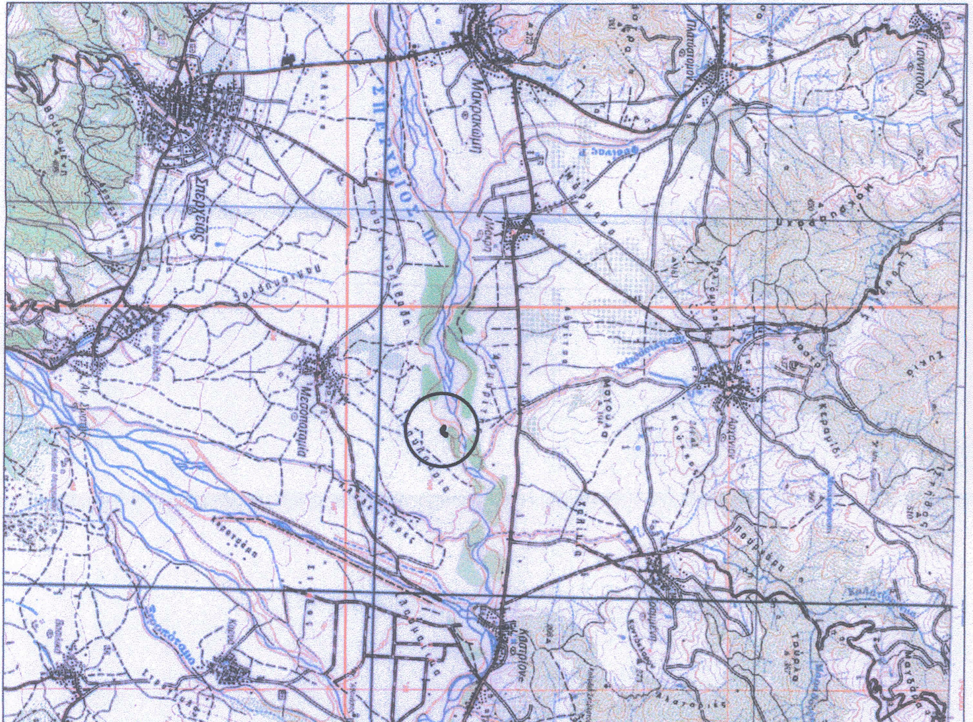
Θεση οριογραμμών σε χάρτη Γ.Υ.Σ., κλίμακας 1:50,000 (απόσταση από αριθμό φύλλου χάρτη 349: "Σιεργιάς")