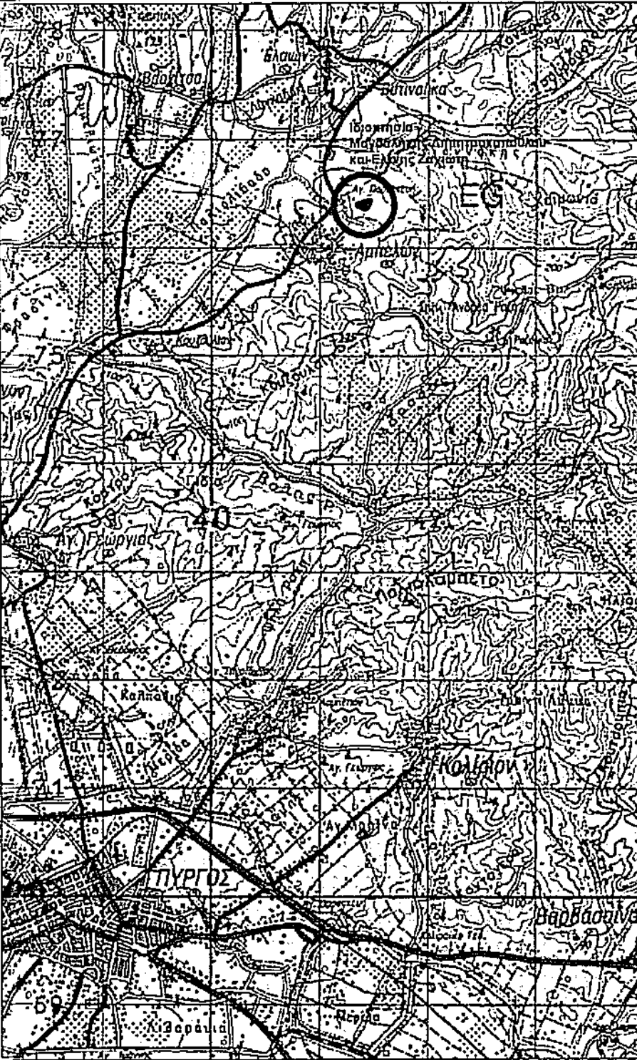
Απόσταση Χάρτη Γ.Υ.Σ - Κλίμακα 1 : 50.000