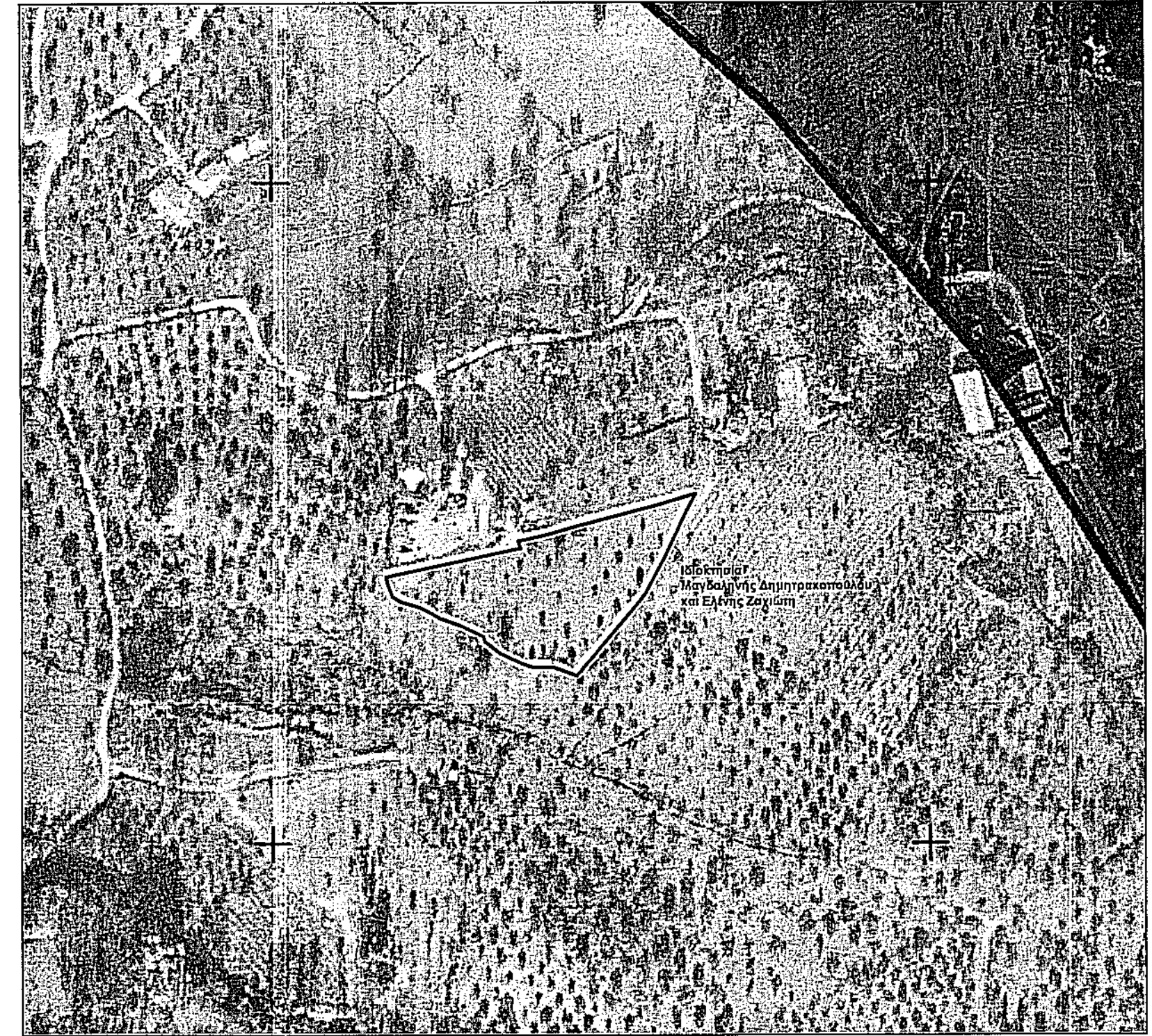
Απόσταση Κτηματολογίου - Κλίμακα 1 : 2.000