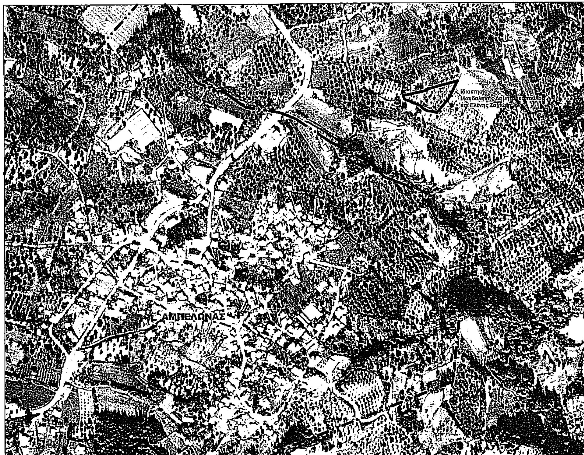
Απόσταση Ορθοφωτοαέρη - Κλίμακα 1 : 5.000