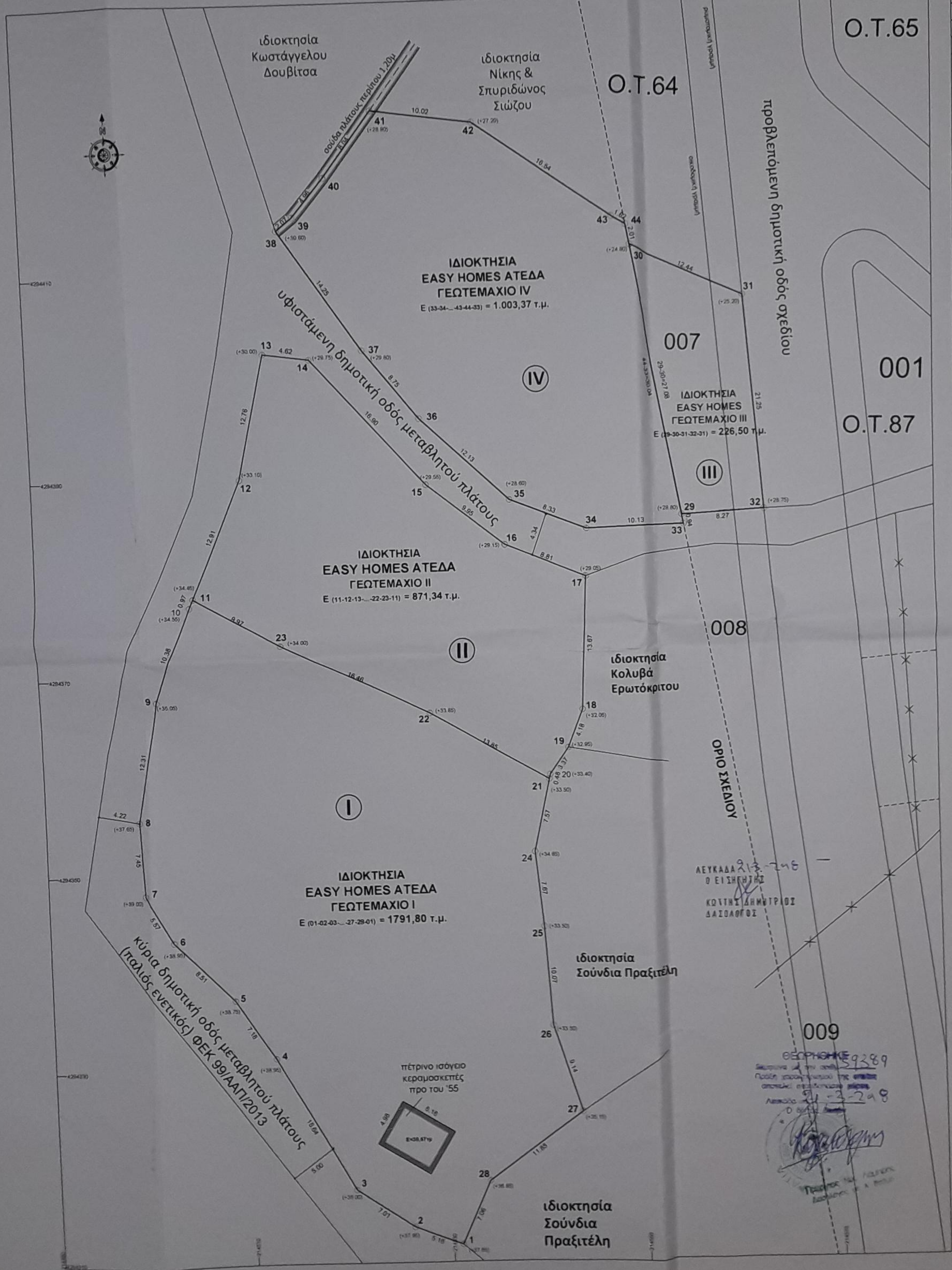
ΣΥΝΤΕΤΑΓΜΕΝΕΣ ΚΟΡΥΦΕΣ ΓΕΩΤΕΜΑΧΙΟ Ι

ΟΡΟΙ ΔΟΜΗΣΗΣ (ΓΕΩΜΑΧΙΟ ΙΙΙ) - ΙΣΧΥΟΥΣΕΣ ΔΙΑΤΑΞΕΙΣ: 11/10/91 ΦΕΚ 849 Δ 18/11/91 4067/12 ΝΟΚ - ΑΠΟΦΑΣΗ ΝΟΜΑΡΧΗ ΛΕΥΚΑΔΟΣ ΑΡΤΙΟΤΗΤΑ ΤΟΜΕΑ ΙΙ (ΑΡΑΙΟΔΟΜΗΜΕΝΟ) = 1000 Μ² (ΚΑΝΟΝΑΣ) ΚΑΛΥΨΗ 60% 1. ΤΑ ΠΡΩΤΑ 100 Μ² 0,80 ΣΥΝΤΕΛΕΣΤΗ ΔΟΜΗΣΗΣ 2. ΤΑ ΕΠΟΜΕΝΑ 100 Μ² 0,80 3. ΤΑ ΕΠΟΜΕΝΑ 100 Μ² 0,80 4. ΤΑ ΕΠΟΜΕΝΑ 100 Μ² 0,40