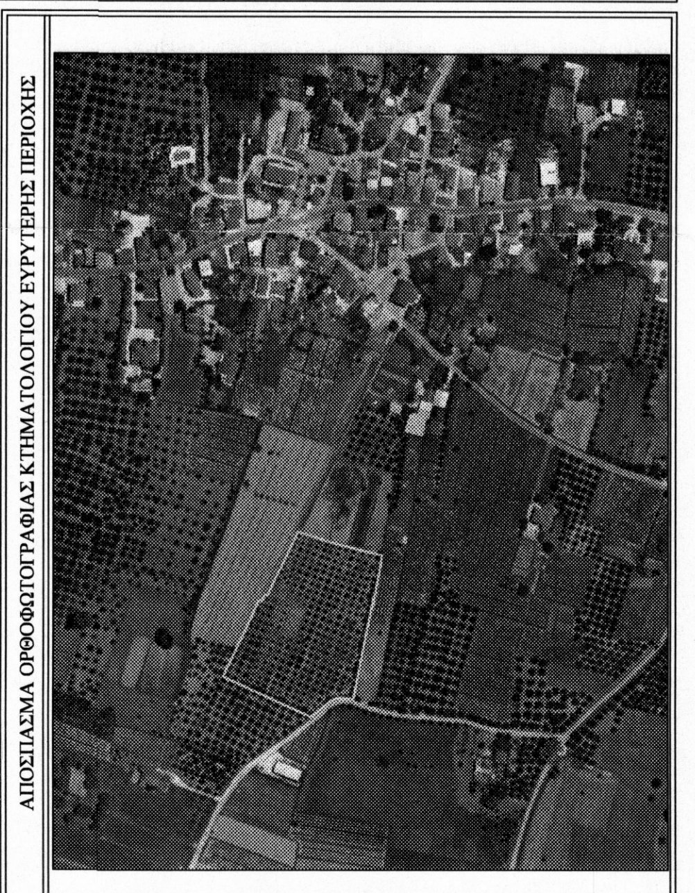
ΑΠΟΣΠΑΣΜΑ ΟΡΘΟΦΩΤΟΓΡΑΦΙΑΣ ΚΤΙΜΑΤΟΛΟΓΙΟΥ ΕΥΡΥΤΕΡΗΣ ΠΕΡΙΟΧΗΣ