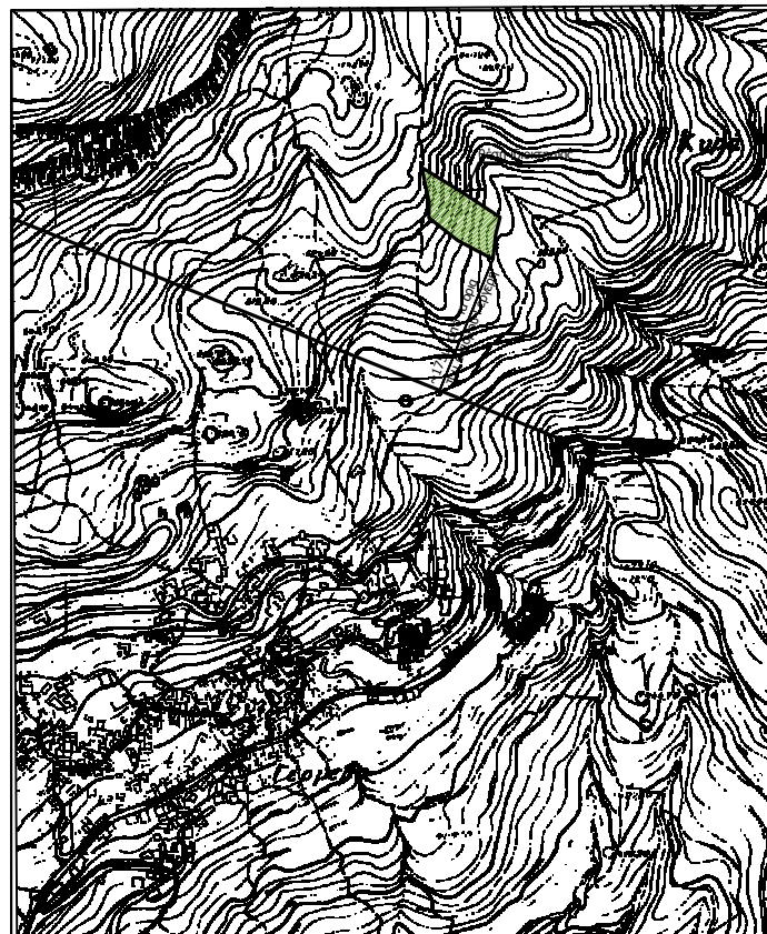
Απόσπασμα χάρτη ευρύτερης περιοχής κλ. 1/5.000