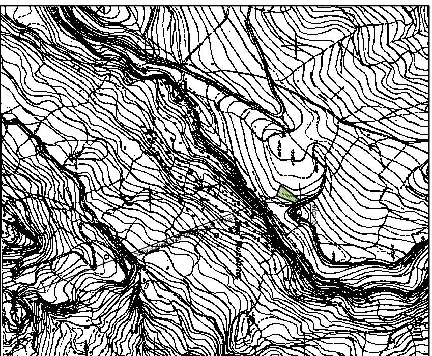
Αντονομία χάρτη εμπορικής κλίμακας 1/5.000