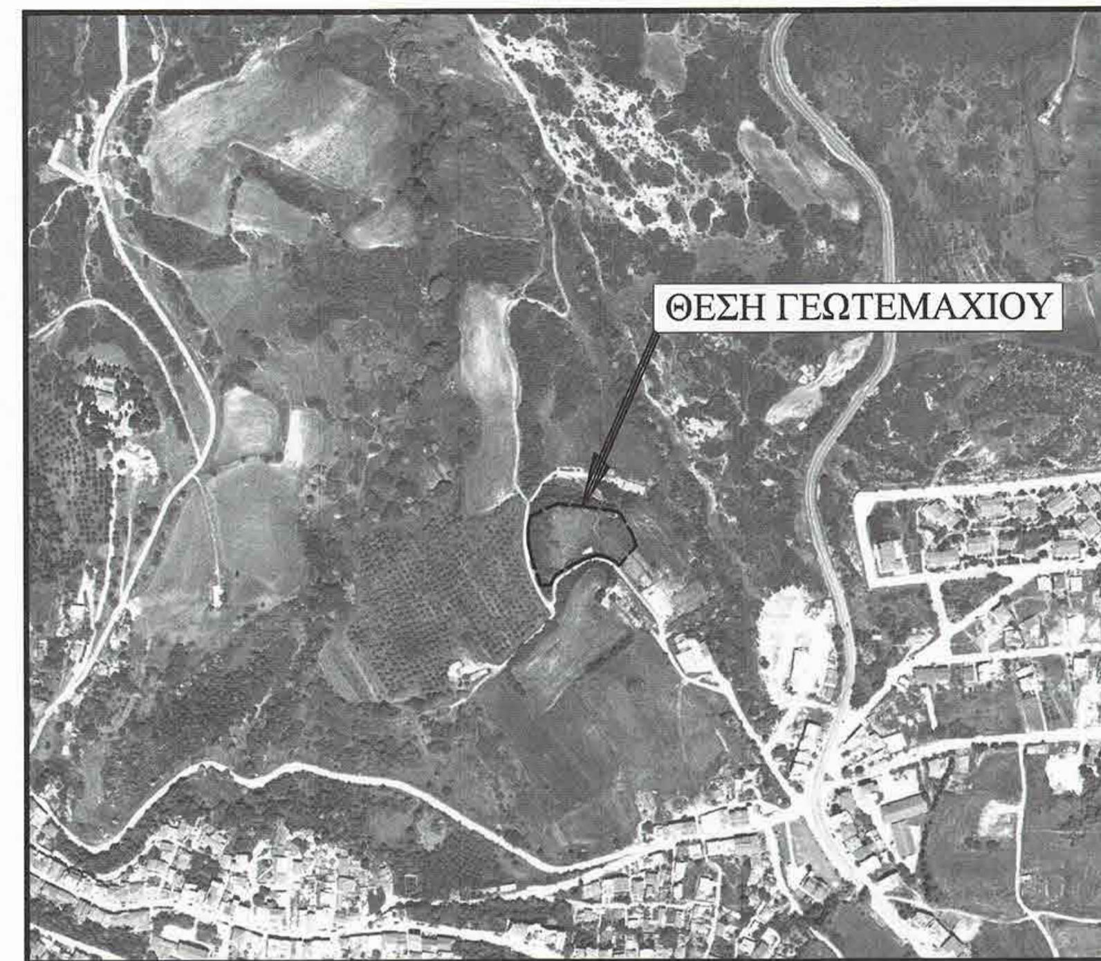
ΣΥΝΤΕΤΑΓΜΕΝΕΣ ΚΟΡΥΦΕΣ-ΣΗΜΕΙΩΝ ΑΓΡΟΤΕΜΑΧΙΟΥ ΕΓΣΑ 87 ΕΓΚΑΡΣΙΑ ΜΕΡΚΑΤΟΡΙΚΗ, ΠΡΟΒΟΛΗ U.T.M. ΕΛΛΗΝΙΣΤΡΩΦΕΙΣ GRS 80, Φ.Χ. 1:50.000