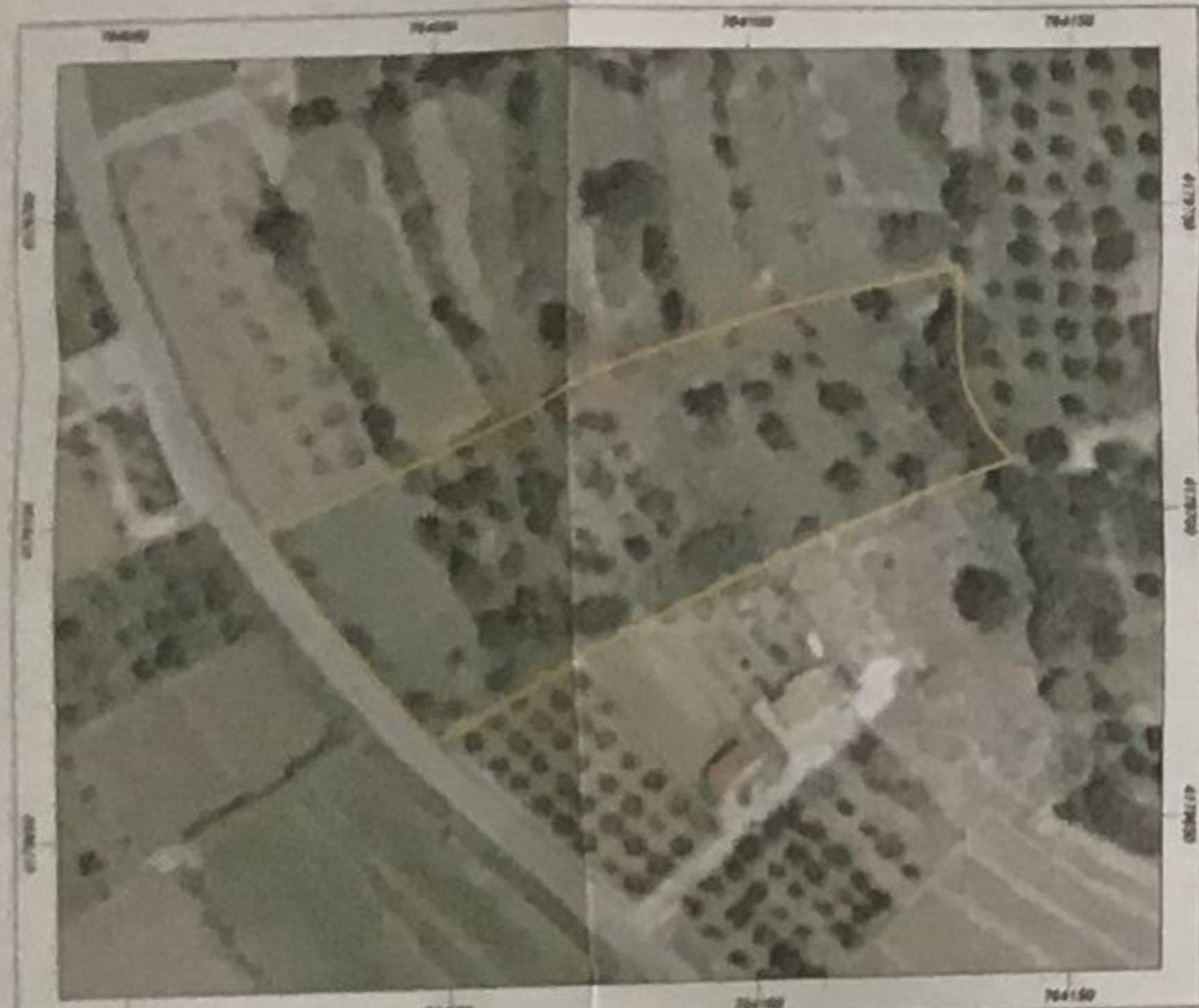
απόσπασμα φωτογραφίας κτηματολογίου