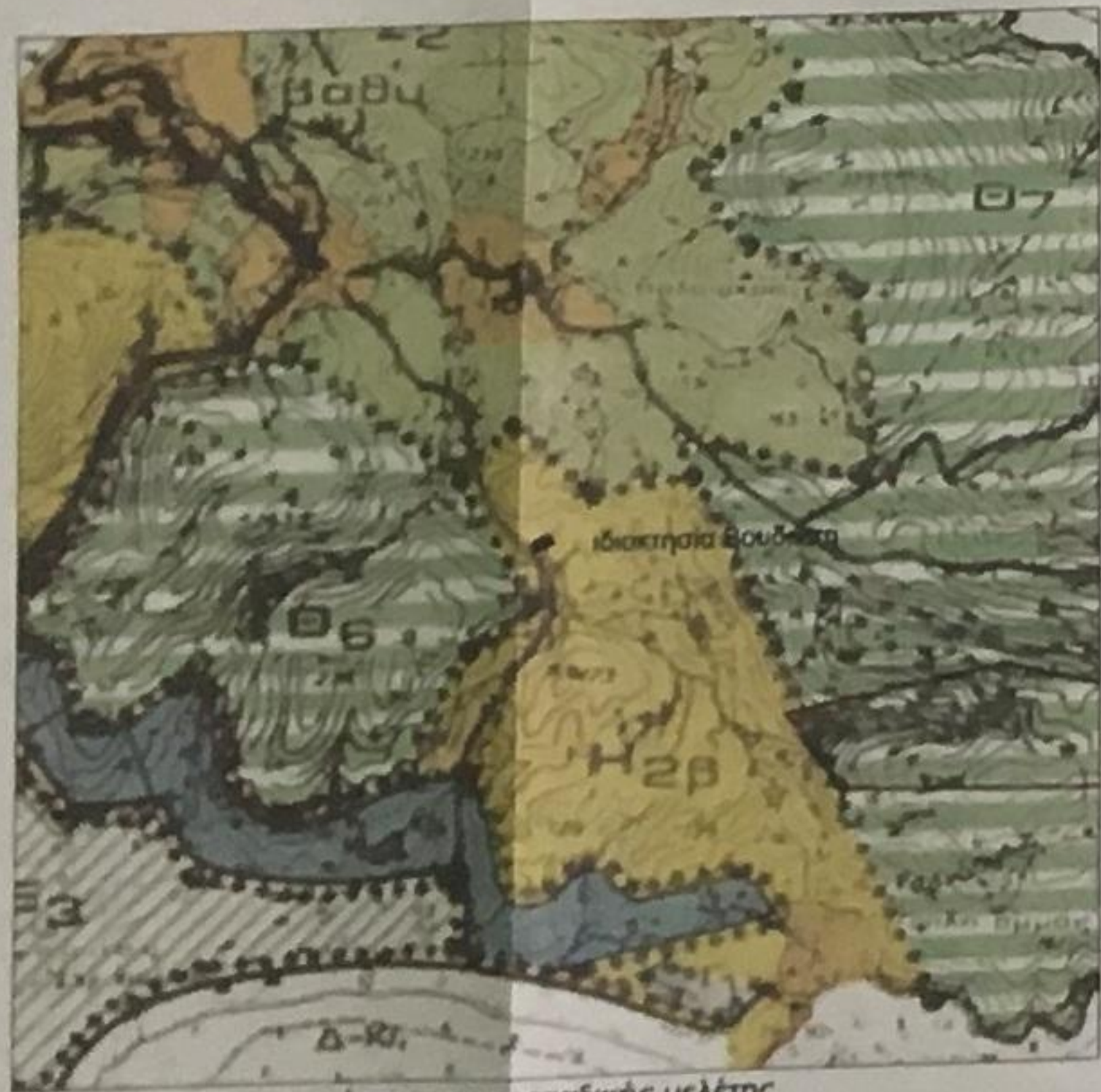
απόσπασμα χωροταξικής μελέτης